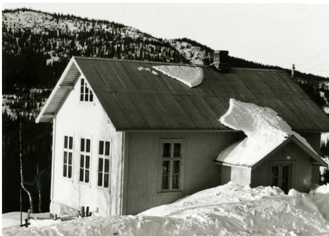
«Åsli skole i Hedalen».