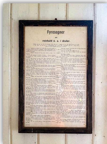
Foto 1: «Fyresegner um reinhald o. a. i skular». Fotograf: Sara E.S Augland

Kulturminnesøk, som ligger innenfor perioden 1800-1900-tallet, så dukker kun et fåtall skolehus opp. Flere av disse er enten kommunalt listeført og uten vern, og kun et fåtall er vernet