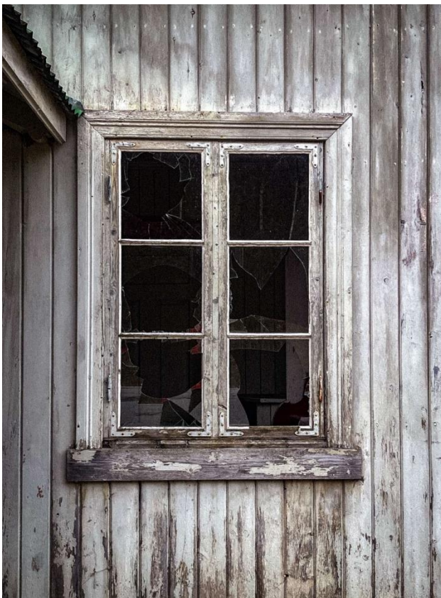
Foto 6: Knust vindu ved bygningens hovedfasade.

Selv om bygget ser ut til å være i relativt god stand, har det vært utsatt for skader, som brøyteskader og fuktproblemer, det er rust på takplatene og råteskader rundt om og flere av